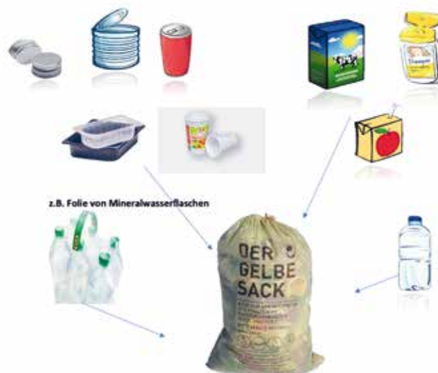
Bitte Plastikflaschen und Getränkekartons flach drücken!

Der Intervall der Abholung wird auf 4-wöchentlich umgestellt!