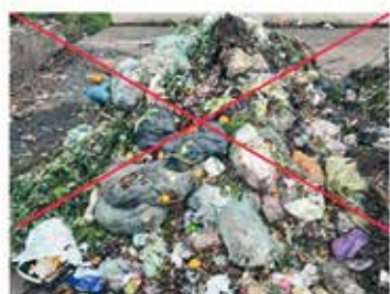
BITTE KEINE PLASTIKSÄCKE IN DIE BIONTONE WERFEN!