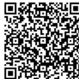
QR-Code für den Fragebogen in Online-Version

Wenn Sie diesen Fragebogen schriftlich oder online ausfüllen, können Sie Kulinarik-Gutscheine „Vom Markt zum Wirt“ und „Biomarkt“-Gutscheine zu je € 20,- (Gesamtwert € 1.500,-) gewinnen! Alle Gewinner werden nach dem 30. April 2022 schriftlich verständigt! Keine Barablässe! Der Rechtsweg ist ausgeschlossen!