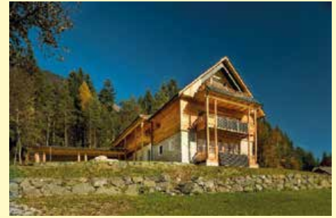
Ein passathon-Leuchtturm ist das Weber Haus in Hermagor.

Amicitiae und Karnische Energie) und aus acht e5-Gemeinden vertreten sein: Arnoldstein, Hermagor, Keutschach, Klagenfurt, Krumpendorf, Ludmannsdorf, Schiefing, Velden.