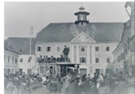
Völkermarkt am Tag der Volksabstimmung

Ein Einführungsvortrag des vormaligen Direktors des Kärntner Landesarchives Dr. Wilhelm Wadl informiert, ausgehend vom Ende des Kaiserreiches in Kärnten bis zur Besetzung des Unterkärntner Raumes durch südslawische Truppen. Der Hauptteil der Veranstaltung umfasst konzertante Darbietungen klassischer Musik, begleitet durch Lesungen und Bildprojektionen. Dabei werden Erinnerungen wachgerufen, die heute noch in Familien tradiert werden oder in Archivalien, Tagebüchern und aus schriftlichen Nachlässen erhoben wurden. Die Texte beinhalten Alltagsberichte aus der Zeit der südslawischen Besetzung des Bereiches Völkermarkt. Der konzertante Teil wird durch Mitglieder eines Quartetts junger Künstler*innen bestritten. Im abschließenden Festvortrag sollen Meriten und Probleme der Multinationalität und der Multikulturalität der alten Monarchie trotz ihres Scheiterns als Möglichkeiten und Aufgabe für das neue Europa, die EU, verständlich gemacht werden.