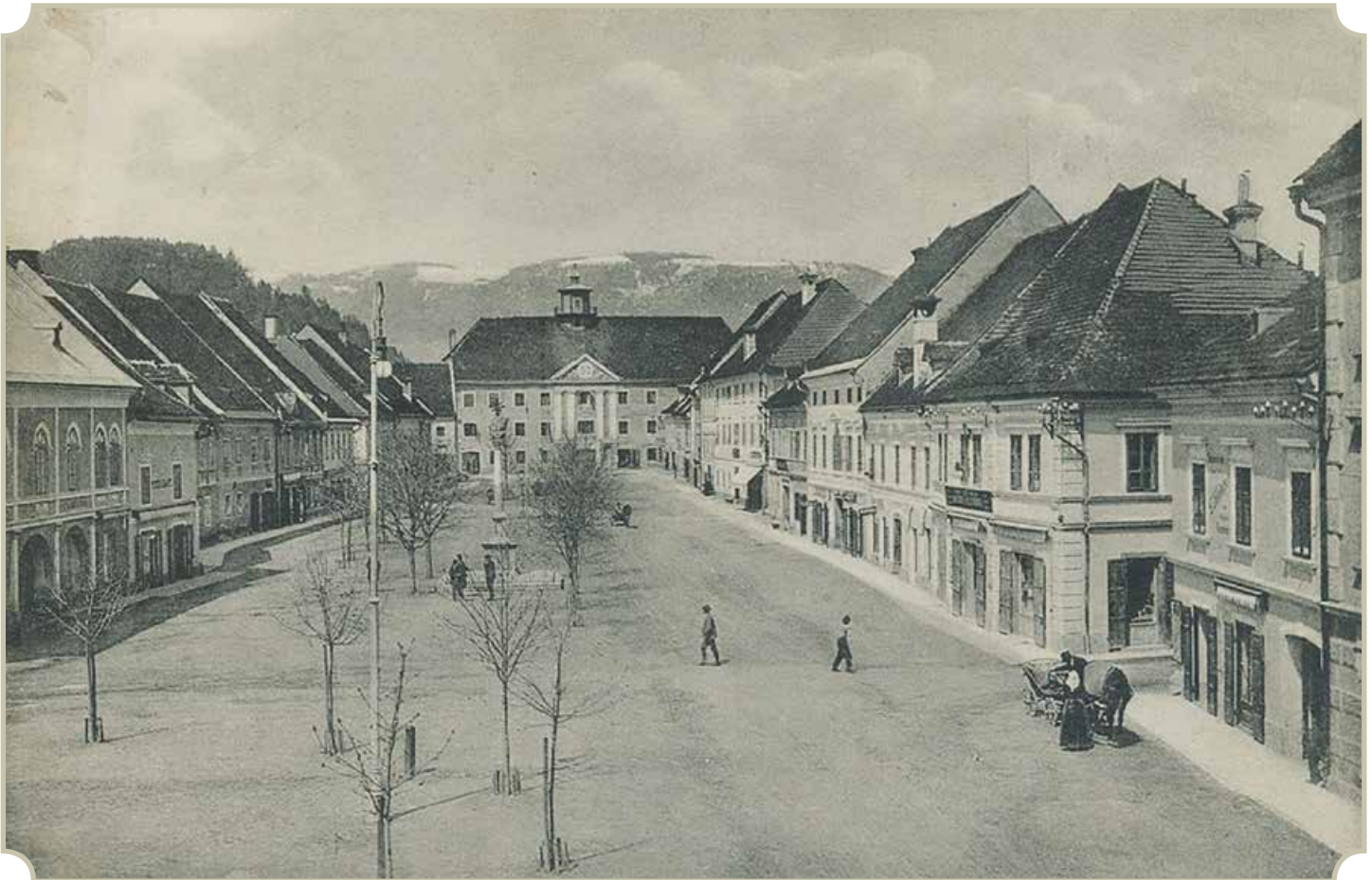
Völkermarkter Hauptplatz 1909