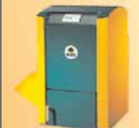
Pellets- und Hackschnitzelheizung

aller Heizungsfaktoren ist die Halbierung Ihrer Heizkosten möglich.