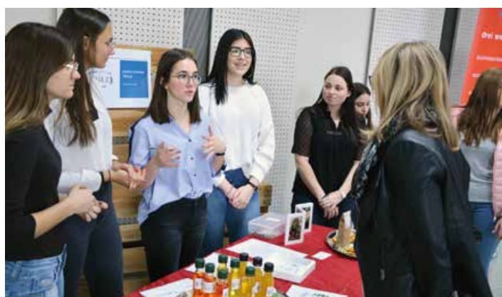
Die Start-Up-Helden von morgen? Gründer schon in Schultagen

Möglich wird dies insbesondere in regelmäßigen Projektphasen, die Wirtschaftskompetenz mit Allgemeinbildung verbinden sollen, aber auch durch Initiativen mit Betrieben und Vereinen aus der Region. Dafür wird es neue Räumlichkeiten geben. „Wir planen einen großzügigen Creative-Working-Space, der Schülergruppen die ideale Umgebung bieten soll, um Vorhaben zu entwickeln. Große Ideen entstehen nicht immer in Garagen, oft hilft auch eine fördernde Umgebung“, meint Graßler. Die Jugendlichen werden an der Praxis-HAK selbst zu Gründern, neben einjährigen Junior Companies ist auch die Schaffung von mehrjährigen Schülergenossenschaften angedacht. Dabei hinterlassen die Schüler deutliche Spuren in der Region, ebenso wie mit Maturaprojekten, die Initiativen wie den Völkermarkter Kulinarikwirten oder der GIVE-Jugendcard Leben einhauchen.