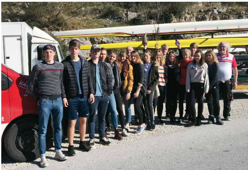
Trainingslager in Kroatien (Limski Kanal Nähe Rovinj)