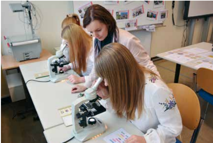
Mehr als Wirtschaft: Auch in den MINT-Fächern stehen Absolventen Wege offen

Schüler und Lehrer arbeiten gemeinsam daran, die Digitalisierung für den Unterricht zu nutzen. Erst im Frühjahr erhielt die Schule von einer Expertenjury den Bundeslandpreis des Starke-Schulen-Awards.