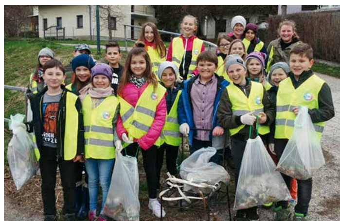
Die Kinder der VS Tainach waren in der Nachmittagsbetreuung mit Begeisterung bei der Flurreinigung dabei.