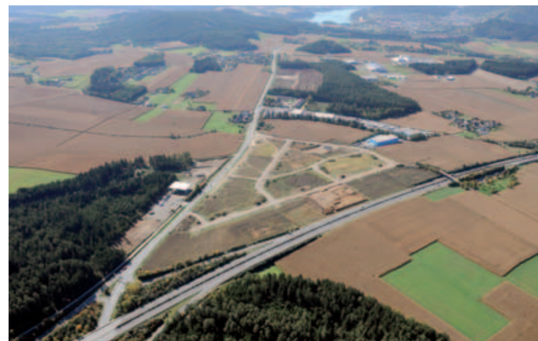
IGP Süd mit direktem Anschluss an die Autobahn A2

Der IGP Süd überzeugt durch seine verkehrsgünstige Lage, mit direktem Anschluss an wichtige Verkehrsachsen wie z. B. die Autobahn A2 (Italien, Slowenien, Deutschland, Ungarn, Wien) sowie die bestehende Infrastruktur vor Ort. Kunden und Lieferanten in Süd- und Südosteuropa sowie in anderen Teilen Österreichs sind schnell und unkompliziert zu erreichen. Die Flughäfen Klagenfurt, Graz und Laibach/Slowenien befinden sich in unmittelbarer Nähe.